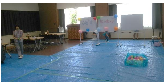
耳原総合病院 こども夏祭り

大腸癌検診推進のところでも触れましたが、国際カンファレンスには一昨年のオスロから研修医の先生が毎回発表を準備してくれていて大きな力となっています。HPH 活動を進めていく中で活動の担い手を増やし、一緒に育ちながら地域の健康づくりを進めていきたいと思っています。