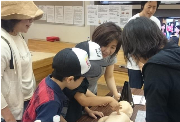
健康まつりにて BLS 講習会の様子

活動を行政と共同するなど、単なる親睦団体を越えた地域のヘルスプロモーション活動を行っています。